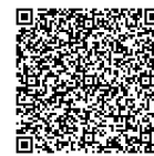
キャンペーンちらしリンク先

https://www.holsc.or.jp/?p=5489&preview=true